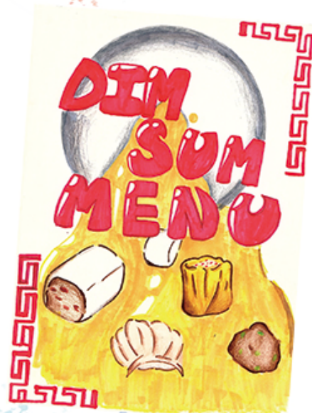
5S 馮寶瑤 (餐牌封面設計)