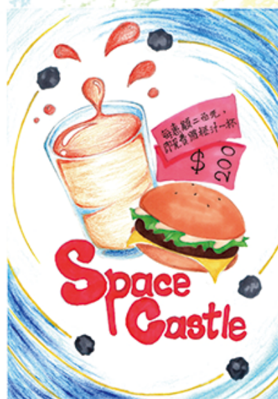
5S 黃麗華 (贈券設計)