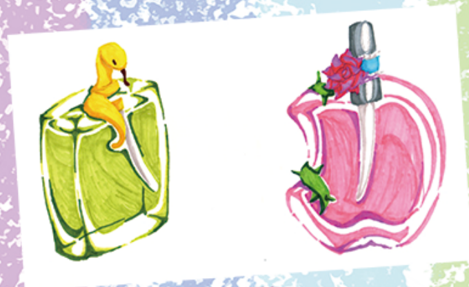
4L 張佳慧 (香水瓶包裝設計)