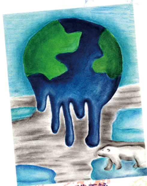
3D 冼天詠 (融化~繪畫)