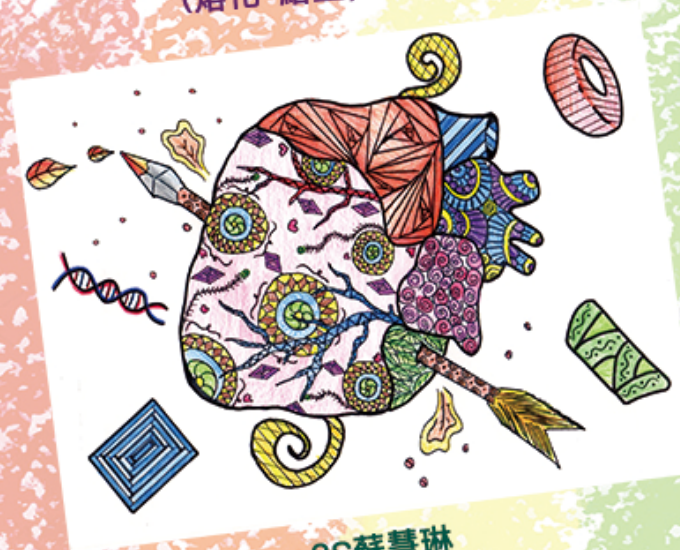
3S 蘇慧琳 (裝飾性繪畫)