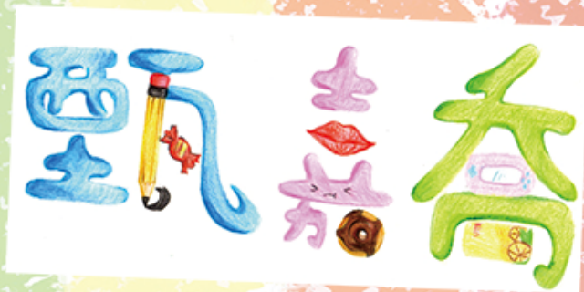
2D 甄嘉喬 (中文文字設計)