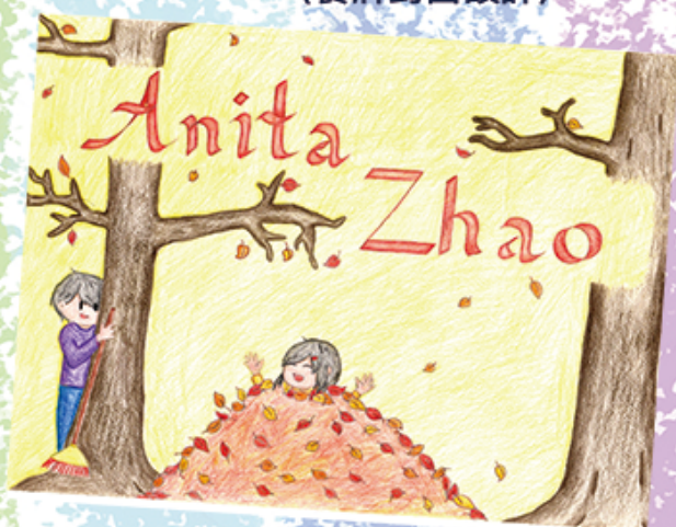
2L 趙曉儀 (英文字體設計)