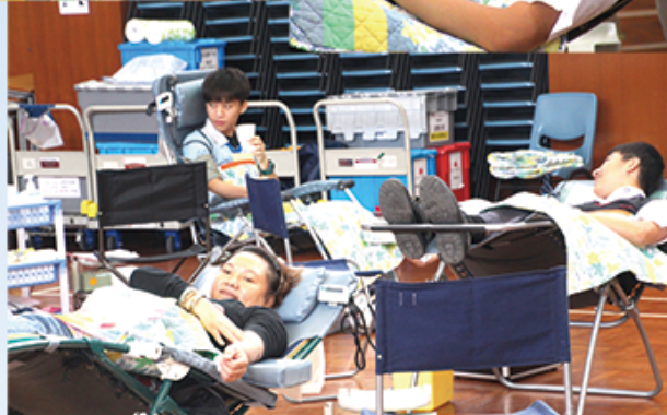
香港科學館—學校文化日 (15/12/17)