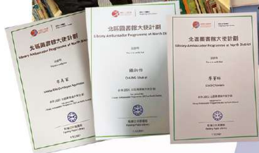
參與同學（左起）： 2L 廖賽琳、3N 鍾淑怡、2L 李美家