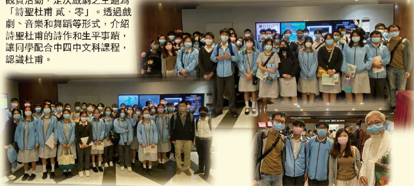
同學在西灣河文娛中心留影

中文科安排中四級同學於2021年10月30日及31日參加由新域劇團主辦之「文化中國系列」戲劇觀賞活動，是次戲劇之主題為「詩聖杜甫 貳·零」。透過戲劇、音樂和舞蹈等形式，介紹詩聖杜甫的詩作和生平事蹟，讓同學配合中四中文科課程，認識杜甫。